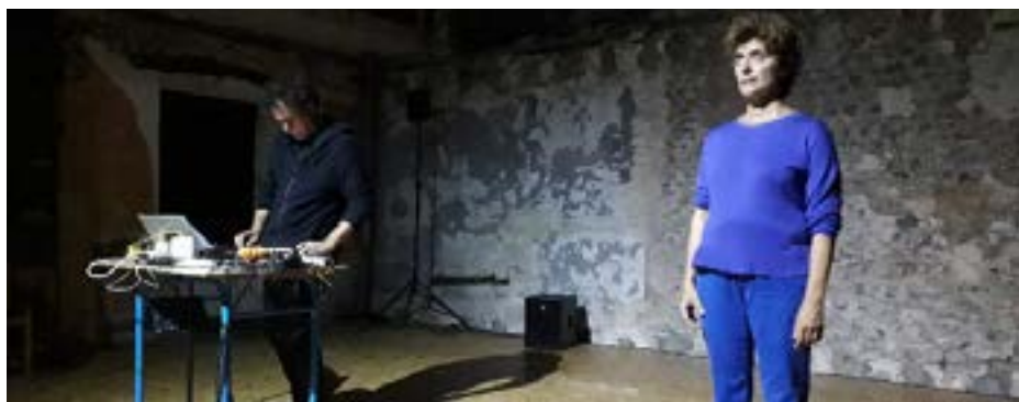
Fille de militaire, édition scénique #4 au Silo, Méréville (91), septembre 2020